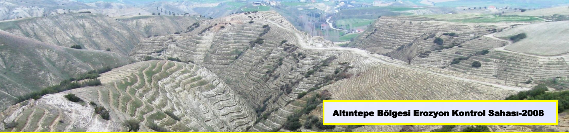
Altıntepe Bölgesi Erozyon Kontrol Sahası-2008