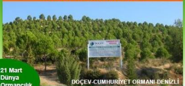
DOÇEV CUMHURİYET ORMANI DENİZLİ