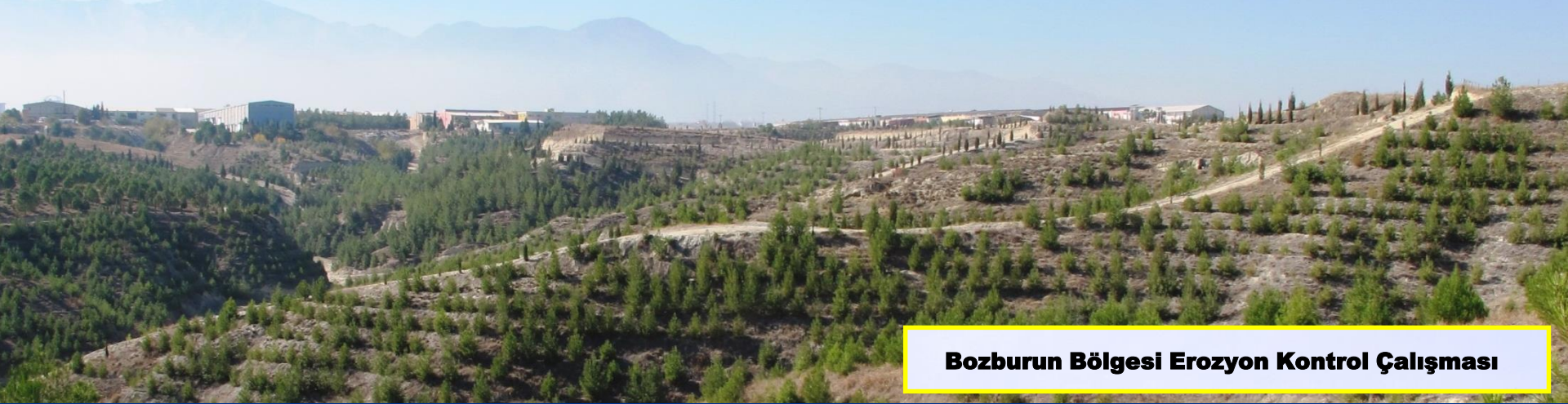
Bozburun Bölgesi Erozyon Kontrol Çalışması

Ağaçlandırma çalışmalarımız ile boş, çıplak, çorak alanlardaki erozyonun yıkıcı etkisini azaltıyoruz.