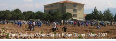
Fatih İlkokulu Öğrencileri ile Fidan Dikimi / Mart-2007

Bereketli'de 8 yaşına gelmiş yaklaşık 500 fıstıkcı ağacının kesilmemesini, sökülmemesini, sahanın peyzajı yapılarak başta otistik çocuklar eğitim merkezi olmak üzere kamunun kullanımında yeşil alan olarak muhafaza edilmesini diliyoruz.