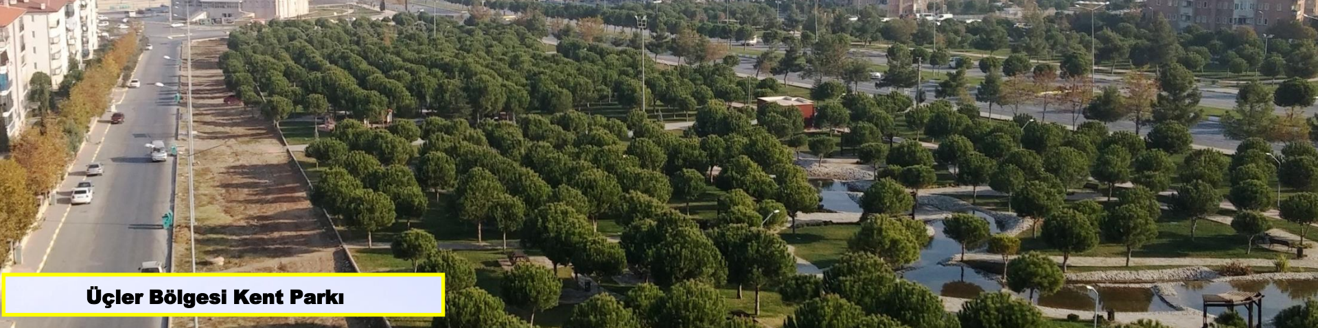
Üçler Bölgesi Kent Parkı

Kamusal alanlara çocuklarımızla beraber diktiğimiz fidanlarla, parklar kuruldu.