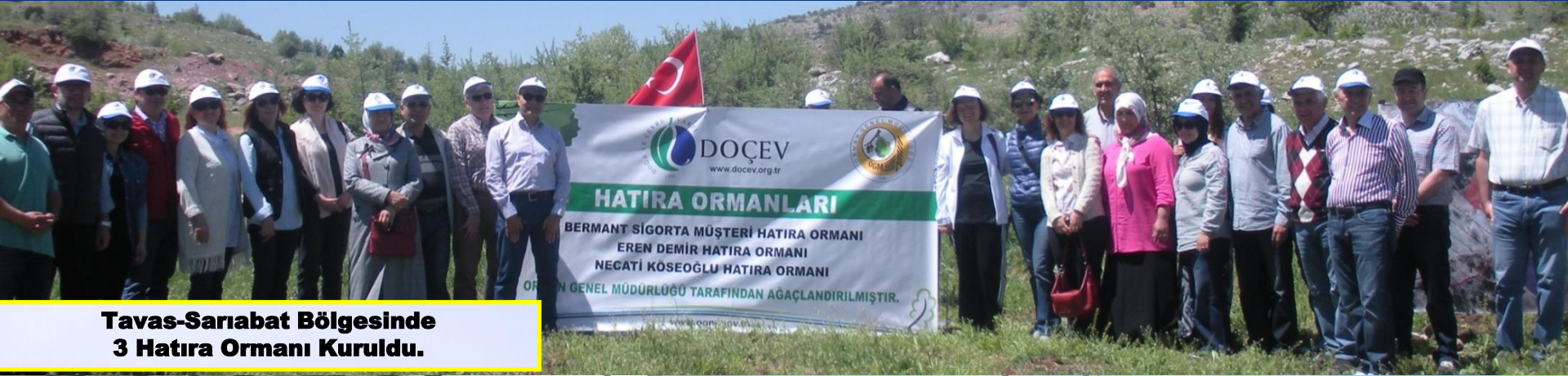
Tavas-Sarıabat Bölgesinde 3 Hatıra Ormanı Kuruldu.