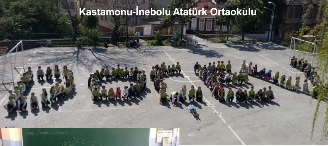
Kastamonu-İnebolu Atatürk Ortaokulu