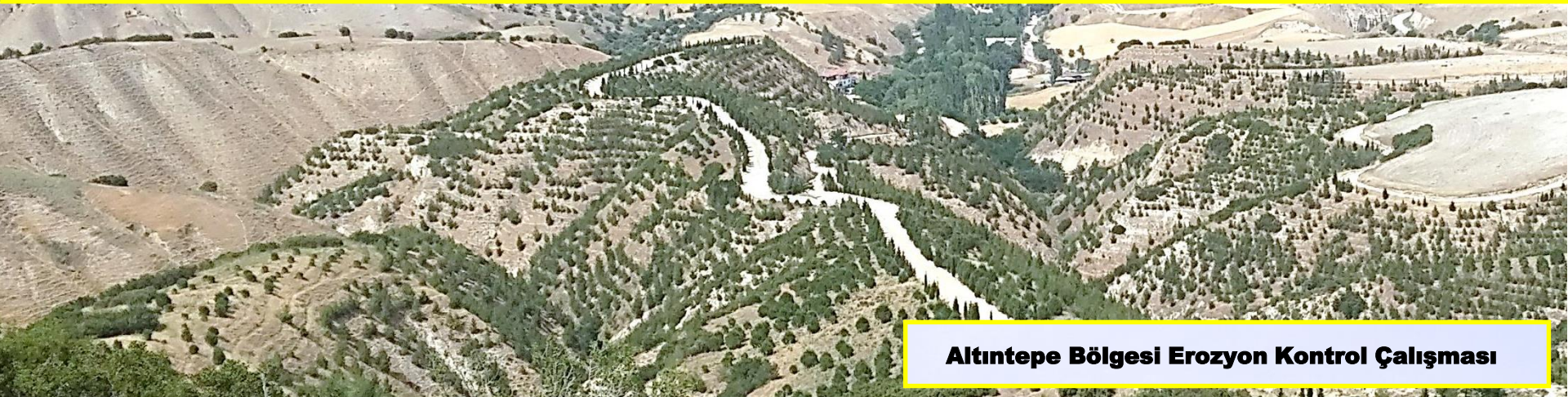
Altıntepe Bölgesi Erozyon Kontrol Çalışması

Ağaçlandırma çalışmalarımız ile boş, çıplak, çorak alanlardaki erozyonun yıkıcı etkisini azaltıyoruz.