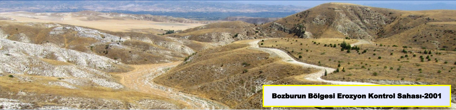
Bozburun Bölgesi Erozyon Kontrol Sahası-2001