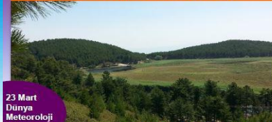
YAYLA GÖLÜ-BULDAN DENİZLİ