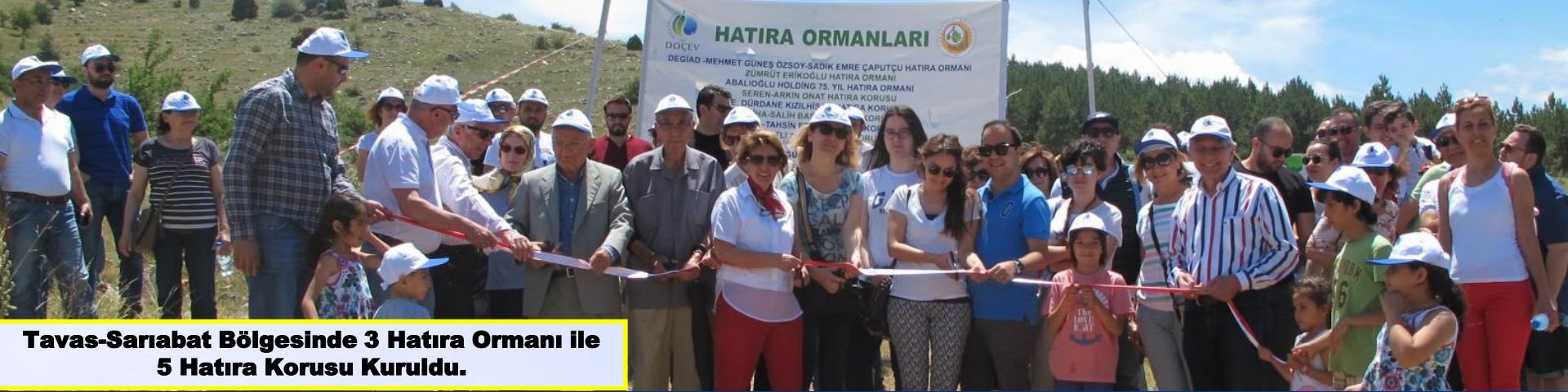
Tavas-Sarıabat Bölgesinde 3 Hatıra Ormanı ile 5 Hatıra Korusu Kuruldu.

“Kendi ormanının kendin kur” yaklaşımı ve çevre dostlarının fidan bağışlarıyla hatıra ormanları kuruyoruz.