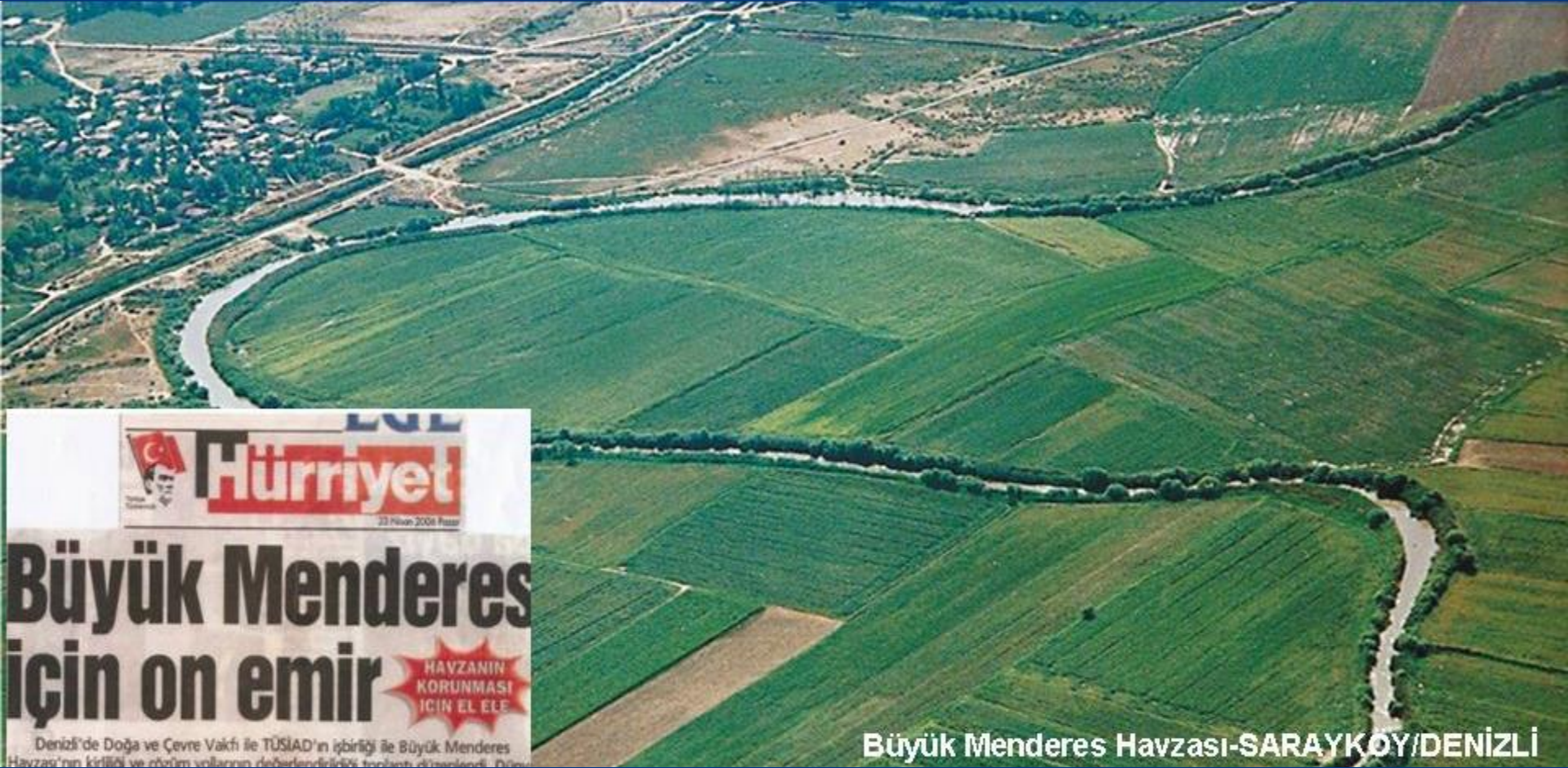
Büyük Menderes Havzası-SARAYKÖY/DENİZLİ

TÜSİAD işbirliği ile Büyük Menderes Havzası kirliliği, etkileri ve çözüm önerilerini kamuoyuna sunduk.