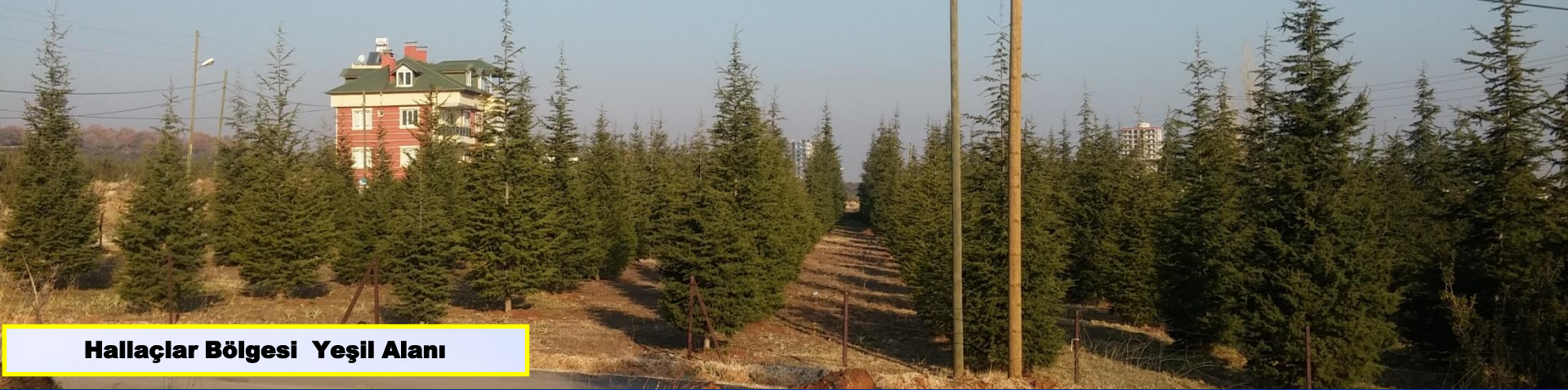
Hallaçlar Bölgesi Yeşil Alanı

Kamusal alanlara çocuklarımızla beraber diktiğimiz fidanlarla, yeşil alanlar oluşturuldu.