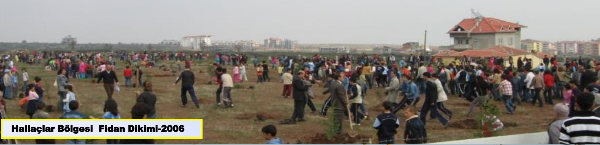
Hallaçlar Bölgesi Fidan Dikimi-2006