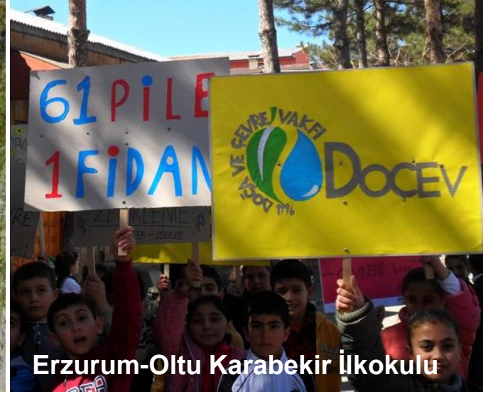
Erzurum-Oltu Karabekir İlkokulu