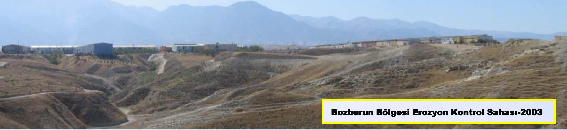
Bozburun Bölgesi Erozyon Kontrol Sahası-2003