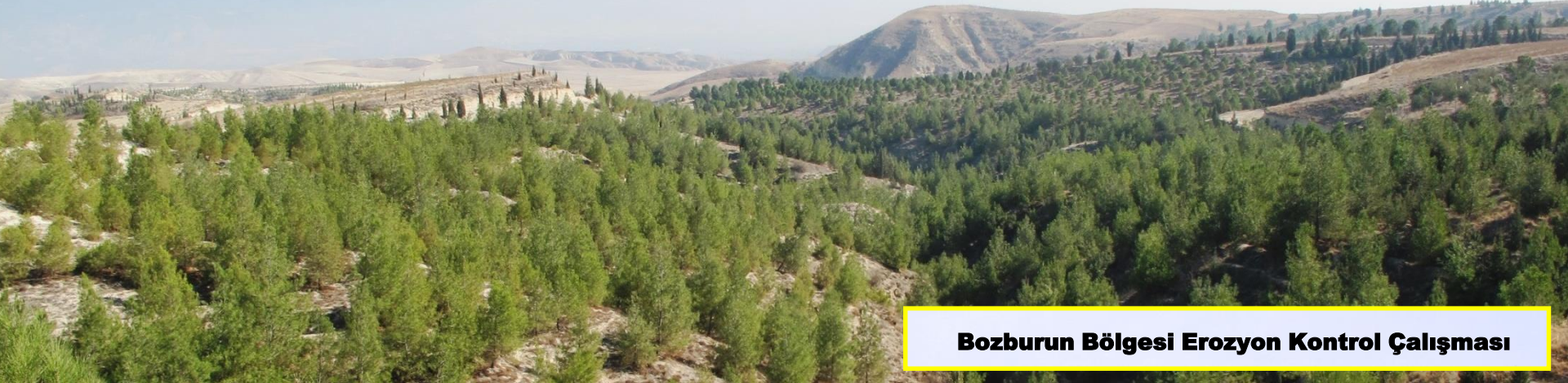
Bozburun Bölgesi Erozyon Kontrol Çalışması

Ağaçlandırma çalışmalarımız ile boş, çıplak, çorak alanlardaki erozyonun yıkıcı etkisini azaltıyoruz.