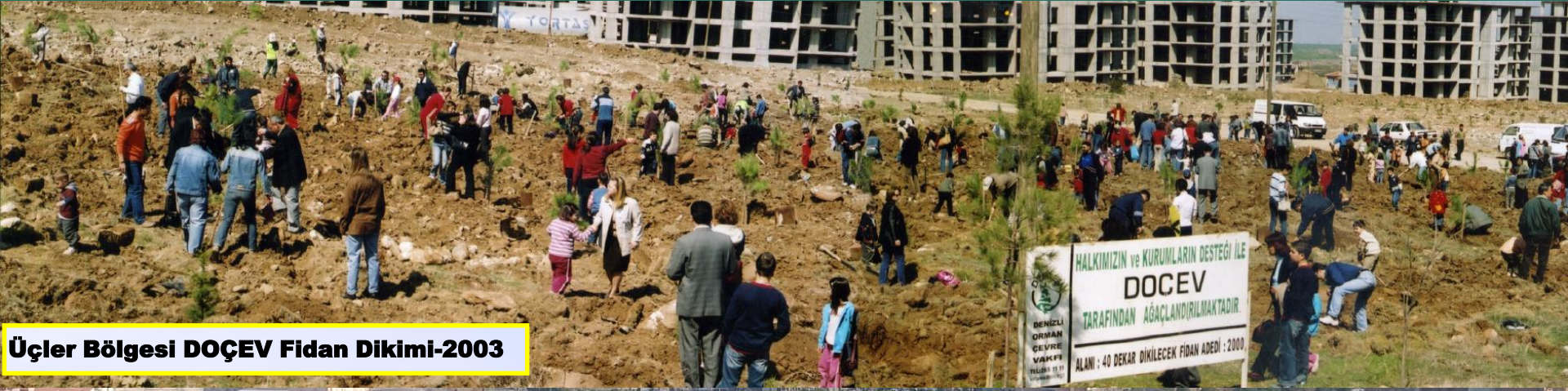
Üçler Bölgesi DOÇEV Fidan Dikimi-2003